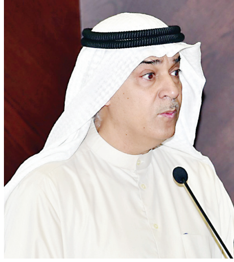
اليوحة متحدثا في المؤتمر

وفهم هذه العملية والآليات الدقيقة التي تؤكد انتقال هذه الحيوانات إلى شبه الجزيرة العربية، كان تحديا بسبب قلة سجلات علم الحيوانات الأثري في العصر الحجري الحديث لهذه المنطقة (zoo archaeological) وفي الوقت نفسه، بينما سجلات الكائنات الحيوانية من مواقع ما قبل ظهور الفخار في العصر الحجري الحديث، والتي تقع في غرب المرتفعات الأردنية ومحيطها كثيرة، فإن مجموعة البيانات في علم الحيوانات الأثري (zoo archaeological) كانت قليلة.