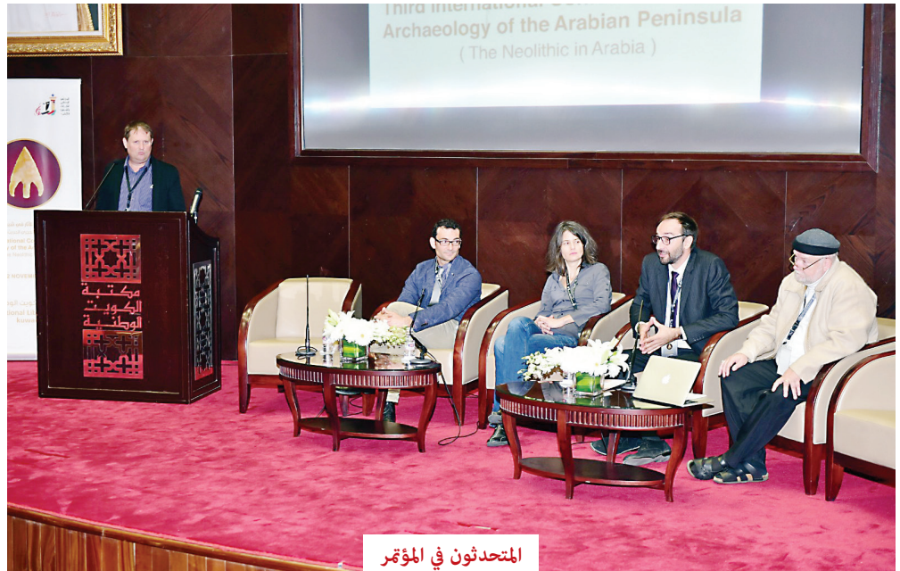
المتحدثون في المؤتمر

وتوالى أعمال المؤتمر الذي يختتم أعماله اليوم الأربعاء، باستعراض عدد من الأبحاث العلمية، حيث يقدم Mr. Kevin lidour من جامعة باريس بحثا بعنوان: تحليل بقايا الأسماك من بيت حجري في العصر الحجري الحديث بجزيرة مروح MR11، الإمارات العربية المتحدة، ويقول في ملخص البحث: كشفت التنقيبات التي أجريت منذ العام 2004 في موقع MR11 عن استيطان يعود إلى النصف الأول من الألفية السادسة قبل الميلاد، والموقع يتميز بوجود بيوت حجرية دائرية الشكل محفوظة بشكل جيد، مستوطنة خلال الألفية السادسة إلى الخامسة قبل الميلاد. والكشوفات الأثرية الحيوانية (Zooarchaeological) بينت أن الأسماك كانت هي