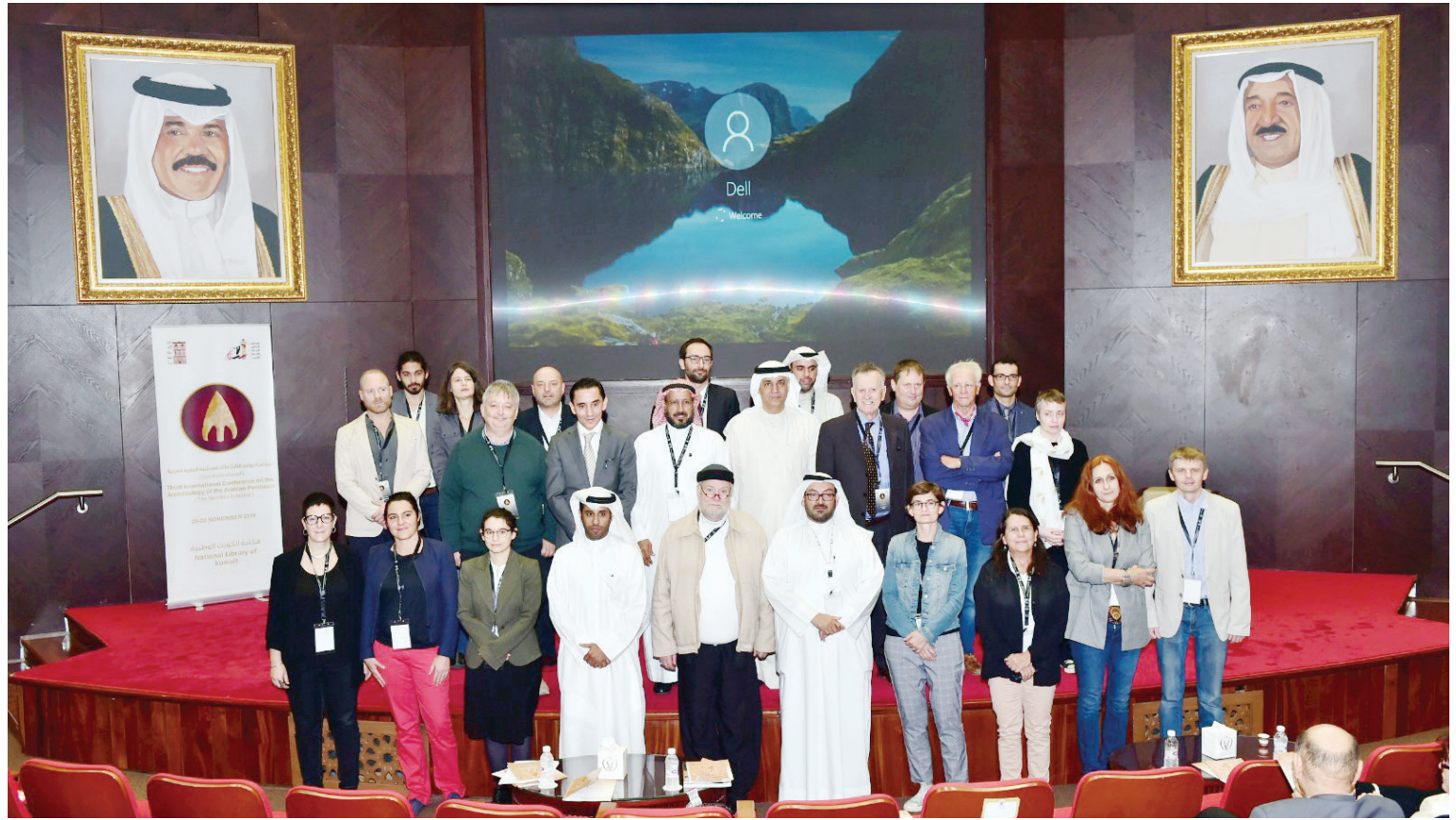
اليوحة متوسطا المشاركين في المؤتمر

الأبحاث الأثرية وخصوصا في العصر الحجري الحديث، كما تتوجه بالشكر والامتنان للمركز الفرنسي للآثار والعلوم الاجتماعية لتعاونه في تنظيم هذا المؤتمر. أملين أن تكون أعمال المؤتمر والدراسات المقدمة فيه خطوة لمزيد من المعرفة وكشف الحقائق في مجال التاريخ.